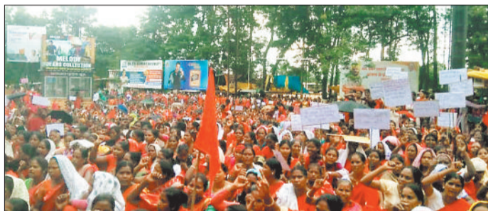
एनएचएम कर्मचारी धरना प्रदर्शन करते।

जशापुरनगर। राष्ट्रीय स्वास्थ्य मिशन कर्मचारी संघ का अनिश्चितकालीन आंदोलन और भी उग्र हो गया है। कर्मचारियों ने स्पष्ट किया है कि जब तक हमारी मांगों पर लिखित आदेश जारी नहीं हो जाता तब तक हम अपना विरोध जारी रखेंगे। कर्मचारियों का कहना है कि विधानसभा चुनाव के दौरान सरकार ने कई वादे किए थे जिनमें मोदी की गारंटी के प्रमुख रूप में प्रचारित किया गया था। इन बातों को पूरा ना किए जाने से कर्मचारियों में भारी नाराजगी है। संघ का दावा है कि 160 से ज्यादा पर ज्ञापन देने के बाद भी सरकार ने हमारी मांगों पर कोई ध्यान नहीं दिया, इसी के चलते 18 अगस्त से प्रदेश के 33 जिलों में लगभग 16000 से ज्यादा कर्मचारी अनिश्चित करे हड़ताल पर है। मनोरा विकास खंड के एनएचएम कर्मचारियों द्वारा पारंपरिक कर्मा नृत्य का मंचन कर अपने समस्याओं से आम जनता को अवगत कराया। नृत्य का उद्देश्य आम जनता आंदोलन के बारे में जान सकें एवं स्वास्थ्य सेवाओं के प्रति आम जनता को होने वाली परेशानी से अवगत कराना था।