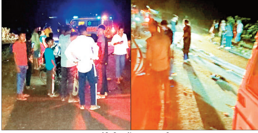
तनावपूर्ण स्थिति, हाईवे पर यातायात बाधित।

प्रत्यक्षदर्शियों ने बताया कि हादसे के समय लगभग डेढ़ सौ लोग विजयन शोभायात्रा में शामिल थे। दोल-नागाडों के बीच श्रद्धालु तालाब की ओर बढ़ रहे थे, तभी रायकेरा की ओर से आ रही बोलेरो अनियंत्रित होकर सीधे भीड़ में शोभे पेज 4 पर